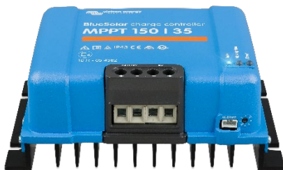
Zonne-laadcontroller MPPT 150/35